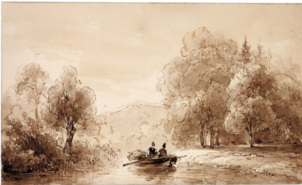
Landschap met roeiboot Andreas Schelfhout 1833. Potlood, pen en penseel in bruine inkt, 9,4 x 16,1 cm STEDELIJK MUSEUM ZUTPHEN

Maar de meest opzienbare bijdrage werd ingebracht door een inwoner van Zutphen: de oudst bewaard gebleven foto die ooit door een Nederlander in Nederland is gemaakt. De maker is de Zutphense apotheker Willem Hallegraeff (1798-1870). Totdat deze opname opdook, was niets bekend over zijn fotografische activiteit. De foto in het album is een gefixeerd negatief. Het gaat hier