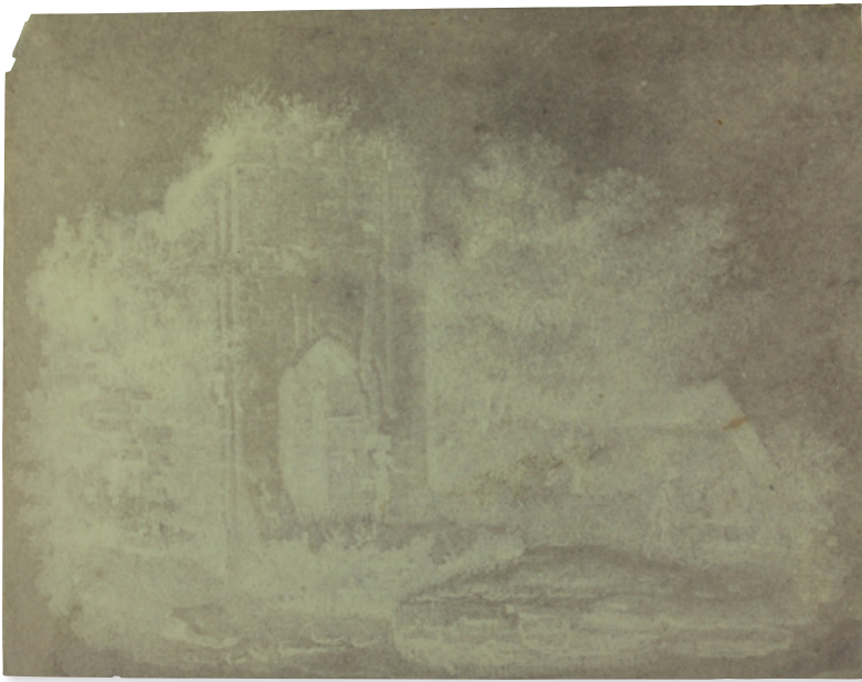
'Eene licht-teekening': de oudste foto van Nederland, 25 november 1839 (gefixeerd negatief)