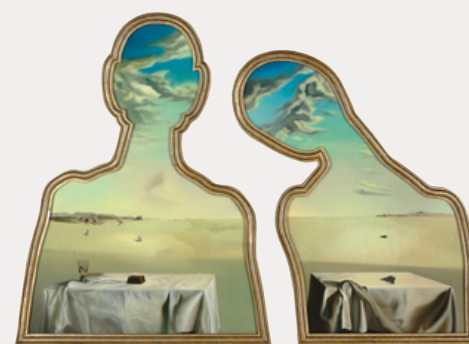
Couple aux têtes pleines de nuages Salvador Dalí 1936. Olieverf op paneel, 92,5 x 69,5 cm MUSEUM BOIJMANS VAN BEUNINGEN, ROTTERDAM

De recent verworven Magritte vormt een prachtig duo met de in 2010 aangekochte installatie Une vipère, un vampire, une vitre van Marcel Broodthaers. Deze Vlaamse kunstenaar is een generatie jonger, maar staat met zijn spel met woorden, objecten en het begrip kunst onmiskenbaar in dezelfde traditie als Magritte. In een interview vertelde hij eens hoeveel indruk diens beroemde Ceci n'est pas une pipe op hem had gemaakt: 'Ik werd achtervolgd door een schilderij van Magritte waarop woorden zijn afgebeeld. Bij Magritte is er die tegenstelling tussen het geschilderde woord en het geschilderde object, een ondermijning van het taalteken en het geschilderde...'