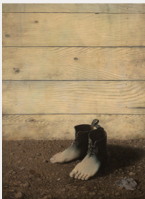
Le modèle rouge III René Magritte 1937. Olieverf op doek, 183 x 136 cm MUSEUM BOIJMANS VAN BEUNINGEN, ROTTERDAM