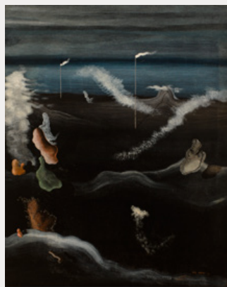
Paysage avec nuages roses Yves Tanguy 1928. Olieverf op doek, 81 x 65 cm MUSEUM BOIJMANS VAN BEUNINGEN, ROTTERDAM

Op het eerste gezicht lijken ze weinig met elkaar te maken te hebben: Magrittes Le miroir vivant uit 1928 en zijn negen jaar later geschilderde Le modèle rouge III . Toch zijn ze duidelijk familie van elkaar en samen laten ze zien hoe Magritte zich ontwikkelde. Waar de kunstenaar zich in de tweede helft van de jaren twintig bediende van taal in de voorstelling, al dan niet in combinatie met beeld, liet hij de beelden na 1930 voor zichzelf spreken. Wat bleef, waren de verwarring en de poëtische, raadselachtige titels. Zijn dit voeten, zijn het schoenen? En waarom Le modèle rouge III ?