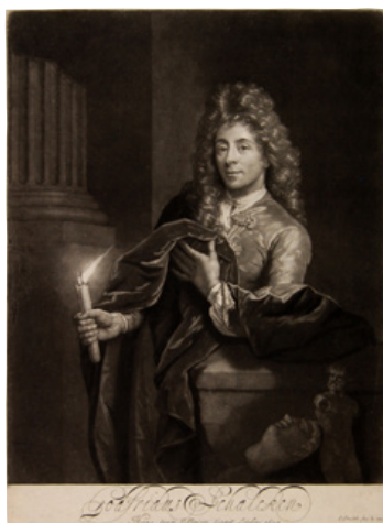
Zelfportret met brandende kaars John Smith naar Godefridus Schalcken 1694. Mezzotint, 344 x 251 mm DORDRECHTS MUSEUM

De nieuwe aanwinst is een studie van licht en emotie. Het schilderij kan gezien worden als een tronie , een term die letterlijk 'gezicht' betekent, maar in de beeldende kunst wordt gebruikt voor een karakterkop, een studie van een gelaatsuitdrukking. Meestal wordt daarbij meteen aan Rembrandt gedacht. Van de beroemde meester zijn talloze geschilderde en ook geëtste karakterstudies bekend, soms zelfportretten, lachend of grijnzend of deels in schaduw gehuld. Schalcken heeft zijn opleiding gevolgd bij twee voormalige Rembrandtlerlingen: hij begon zijn leertijd bij de Dordtse meester Samuel van Hoogstraten en leerde de finesses van het vak bij Gerard Dou in Leiden.