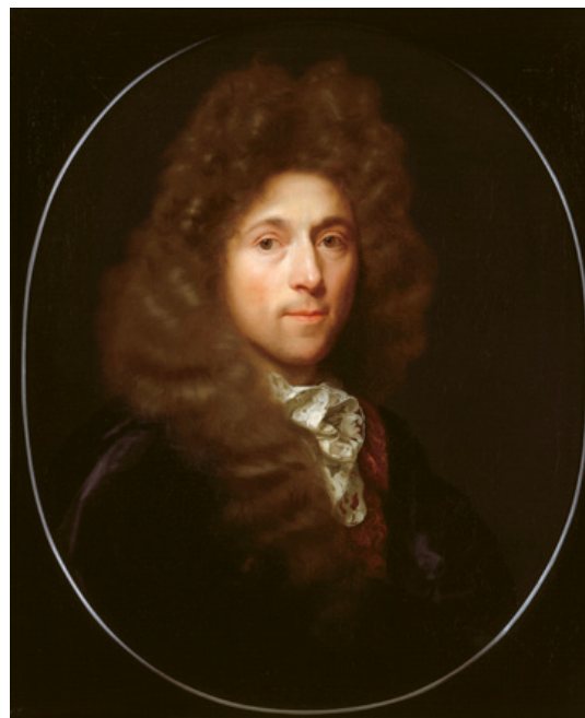
Zelfportret Godefridus Schalcken ca. 1690-92. Olieverf op doek, 68,3 x 56,6 cm (ovaal) DORDRECHTS MUSEUM