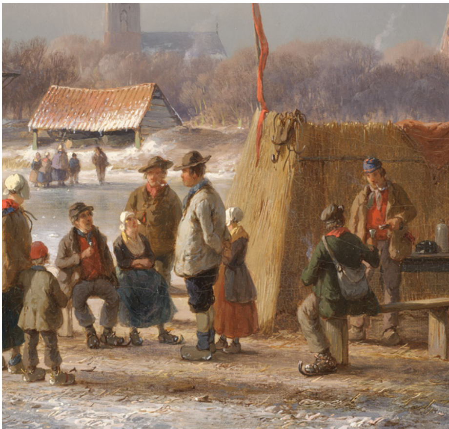
Detail van Schaatsers bij een Hollandse stad van Andreas Schelfhout